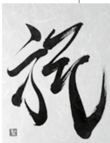
© Tabi : voyage